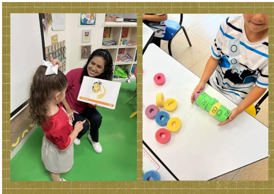
figura clave en los colegios , pues siempre está dispuesto atender las inquietudes de los docentes a lo largo de cada ciclo escolar, brinda retroalimentación del proceso y apoya con cualquier situación relacionada con la plataforma y los recursos del programa.

La llegada de Ludiletras a los Liceos tuvo lugar durante la pandemia de la covid-19, por lo que su implementación fue todo un reto para los equipos directivos y docentes. Gracias a la flexibilidad del programa, lograron superar el desafío instaurando un modelo híbrido , adaptándolo para trabajarlo desde casa y en el colegio. Para las sesiones contaban con 2 docentes, una en virtual y otra en colegio, por lo que una comunicación fluida era esencial para evitar desfases. El resultado de esta buena sinergia entre docentes fue que las sesiones discurrieron sin obstáculos, y el programa fue acogido de manera excelente entre los alumnos .